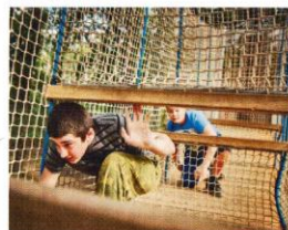
ILUSTRÁČNÍ FOTO OPLÁŠENÍ V DOMEČKU: